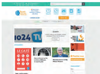
Le site officiel diocese24.fr

La page Facebook : facebook.com/diocese24