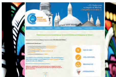
Le don en ligne don24.fr